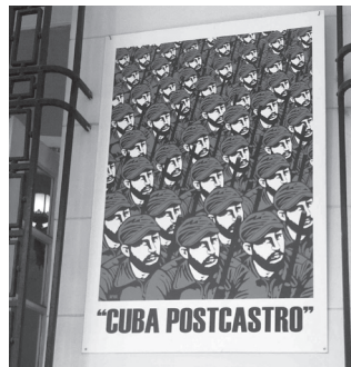
Figura 1. Cartel en la puerta de la UNEAC

Véase por ejemplo el cartel que figuraba el verano del 2012 en la puerta de la UNEAC (Figura 1), donde aparece repetido en fila el rostro de Fidel Castro