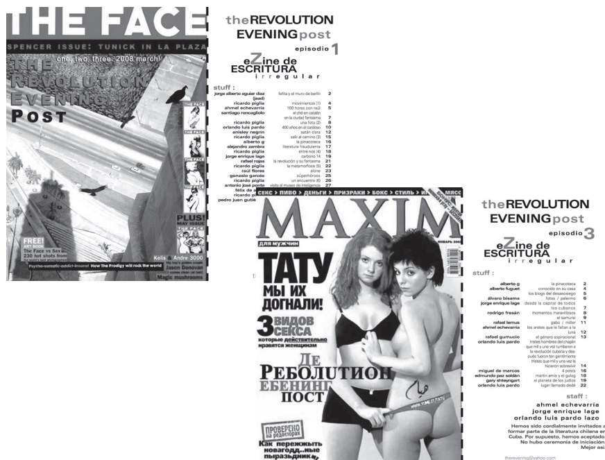
Figura 3. Portadas de los números 1 y 3 de The Revolution Evening Post (TREP)

El poema establece una oposición entre ciudad inerte / silenciada, ungüento, que es la del sujeto lírico y que incluso coincide con el ser del sujeto lírico, y la ciudad que se fusiona con la nación, donde el lenguaje coincide con aquello pronunciado por labios de seguimiento, con palabrería no eficaz y sustantivos tan estáticos como muebles para dormitorio. El ungüento marca el límite entre piel y ciudad, el límite entre la voz adentro que busca lenguaje y un discurso estático afuera. La nada-nadería-nadurria sería el puente entre los dos, jugando con la musicalidad, el signifiante, el no-sentido de las palabras grandes como la nación, yuxtaponiéndolas con la nada. En el poema se observa la misma búsqueda que la que describo aquí sobre el espacio virtual, una forma activa de transformar el espacio público de modo que los poetas puedan encontrar su voz sin tener que tropezarse continuamente con un inmovible discurso nacional 10 .