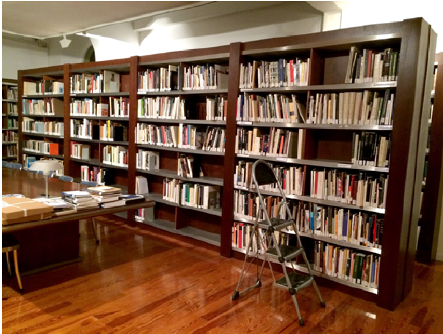
Lecturas arbitrarias Acción en una librería