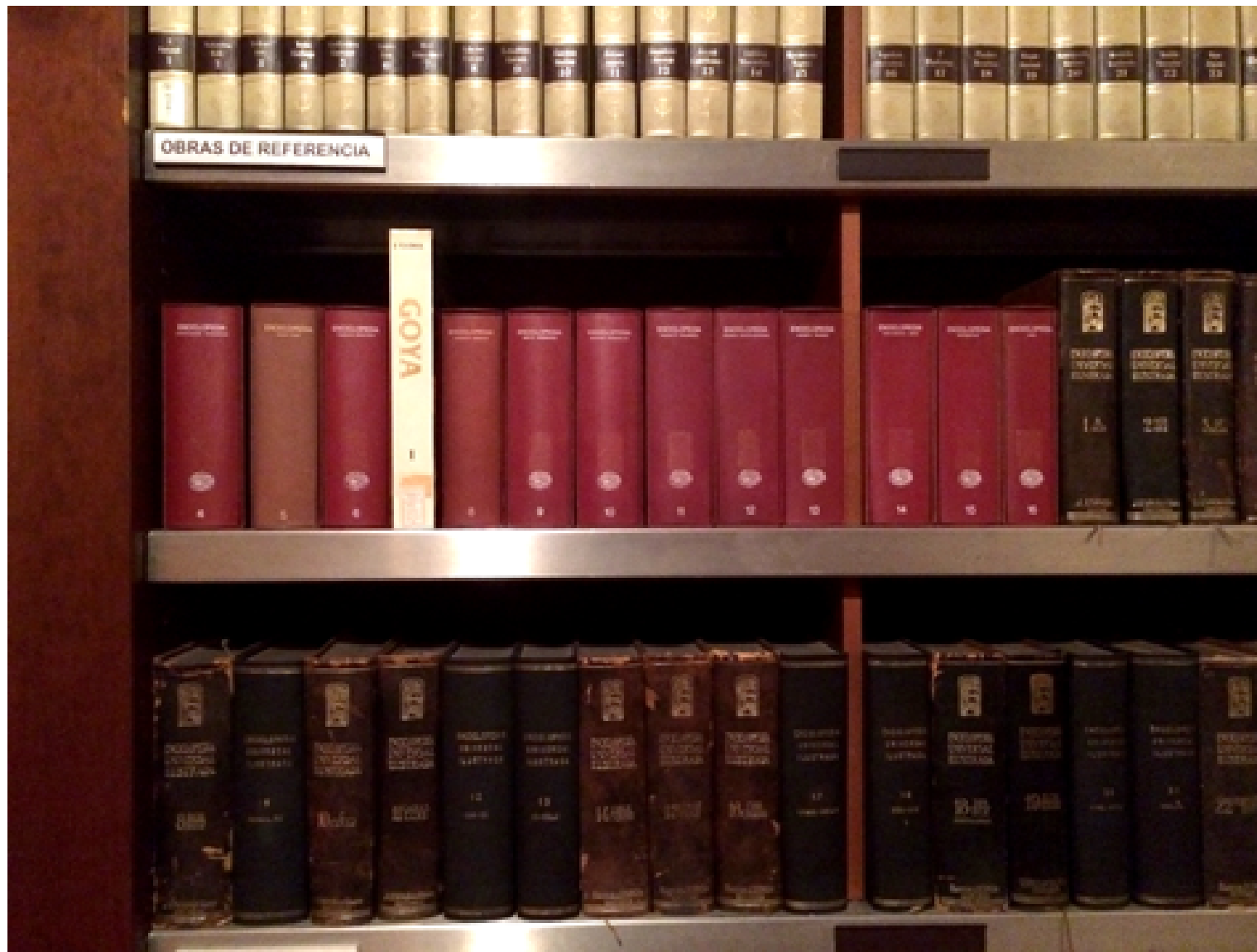
Lecturas arbitrarias Acción en una librería