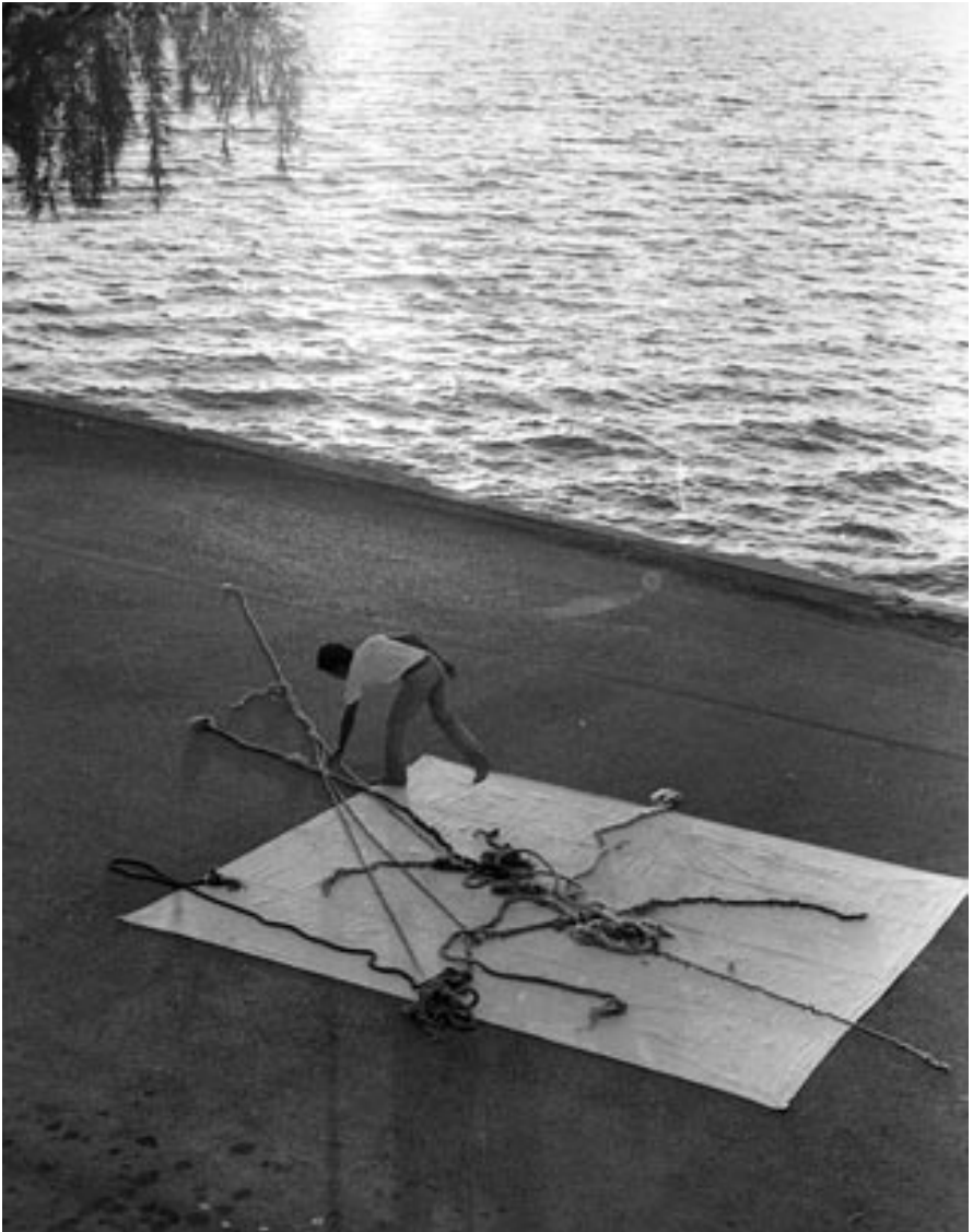
Performance El hombre y sus estrobos http://www.leandrosoto.com/leandro-soto-artist-bio.html

confinado a su destierro de purgación ideológica. 2 Pero Ancestros (1979) trascendió el espacio local de la provincia, y se embarcó en una expedición que dura hasta hoy en día, un viaje que resemblance el de las diversas fuentes ancestrales del artista en su dimensión caribeña.