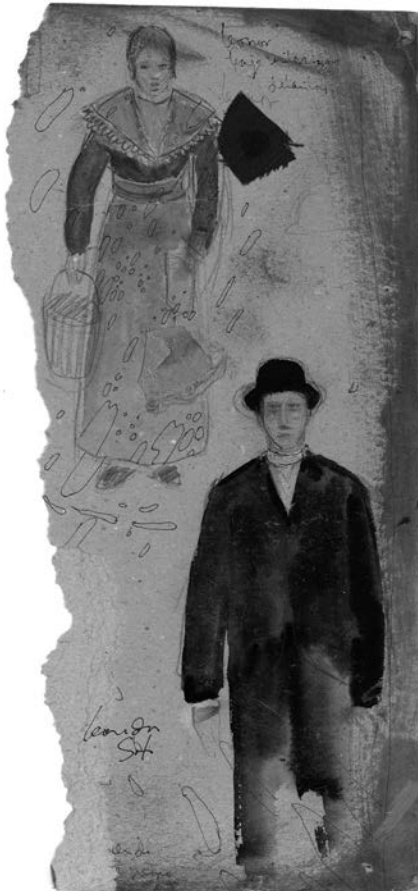
Boceto de vestuario

La vieja dama muestra sus medallas .