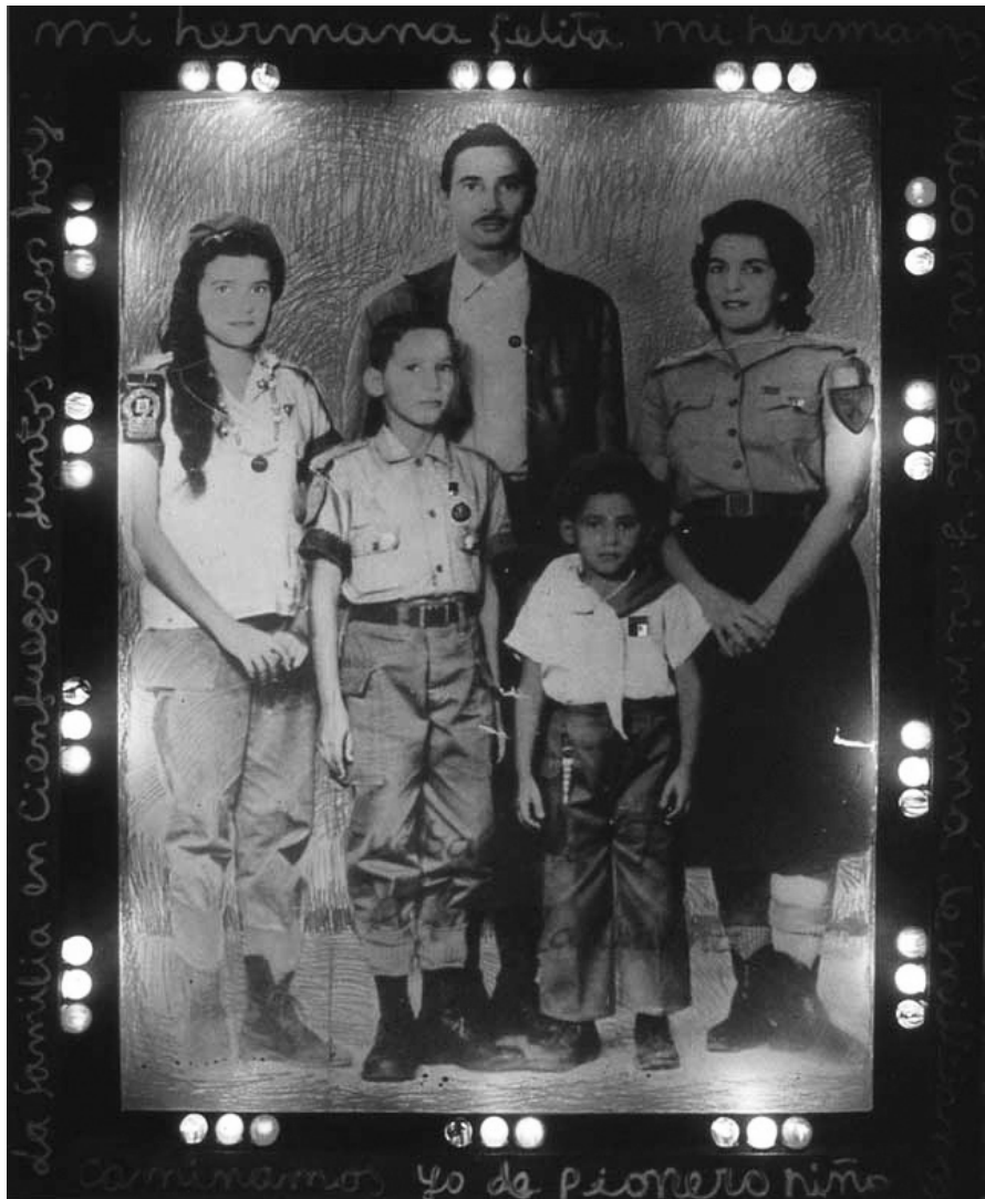
La familia revolucionaria

http://www.leandrosoto.com/elements/work/familia-revolucionaria/01-familia-revolucionaria.jpg